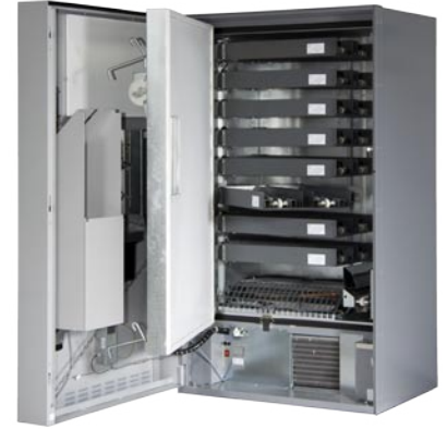
Interior de IcePlus Food IcePlus Food Interior