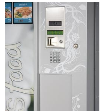
Display LCD y botonera numérica LCD display and numeric selections buttons