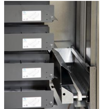
Ascensor de entrega de producto Product delivery elevator